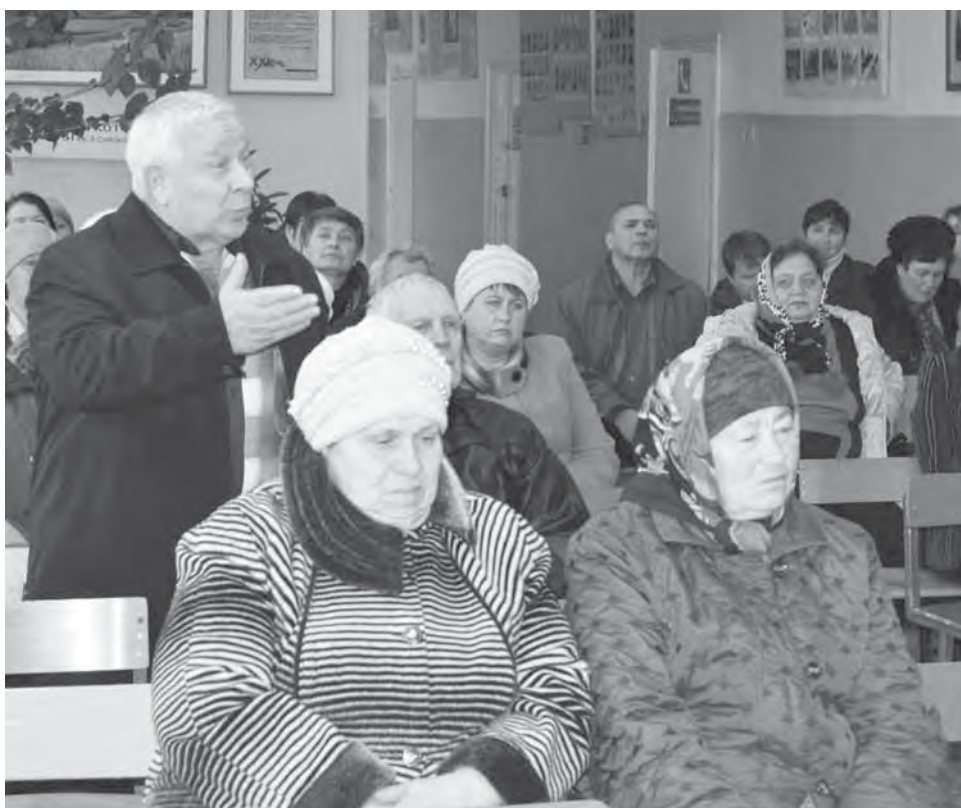
Жители поселения задавали вопросы в довольно острой форме

– Подождите, а кто виноват, что все мы говорим своим детям: «Оставайтесь