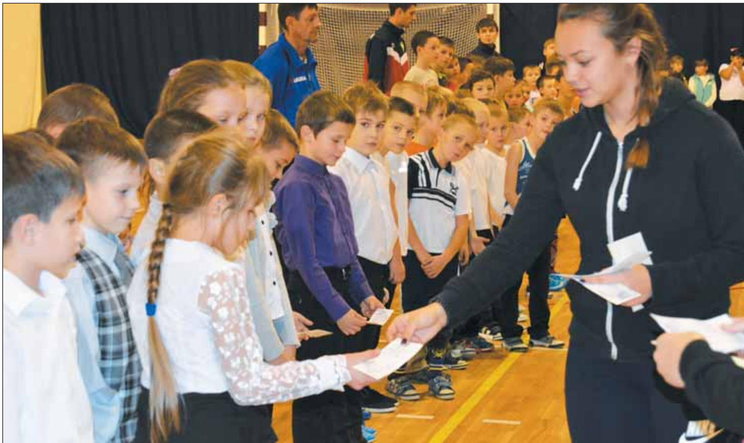
Путевки в спортивную жизнь ребятам вручили старшие товарищи