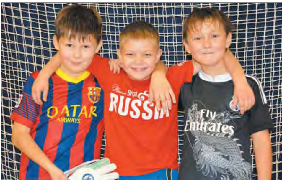
Общая любовь к футболу – начало крепкой дружбы