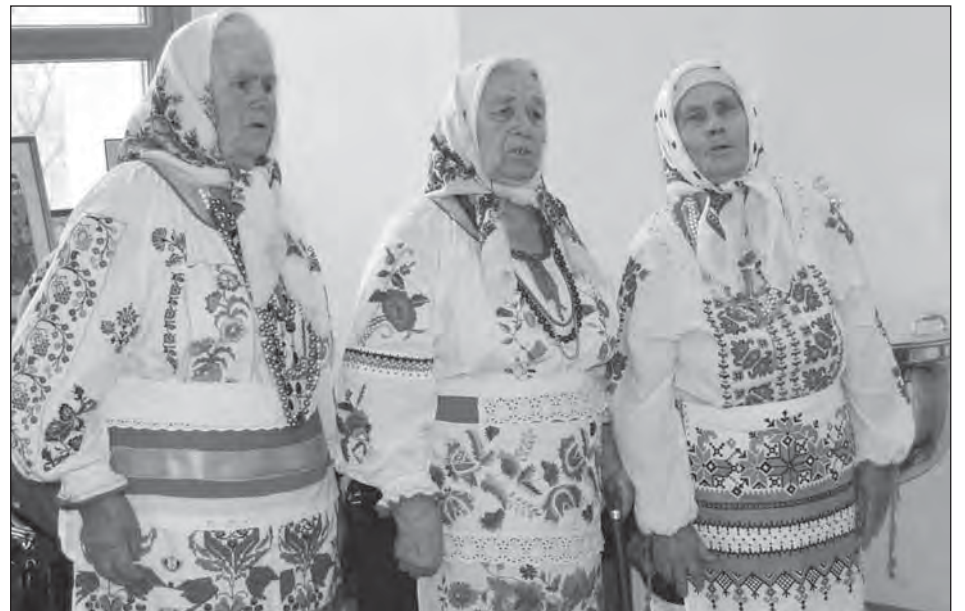
■ Песни в исполнении коллектива «Журавушка» растрогали слушателей до слез

Все желающие могли полюбоваться выставкой работ мастеров Дома народного творчества и ремесел, а также богучарских умельцев. Одна из картин, сделанных жительницей города