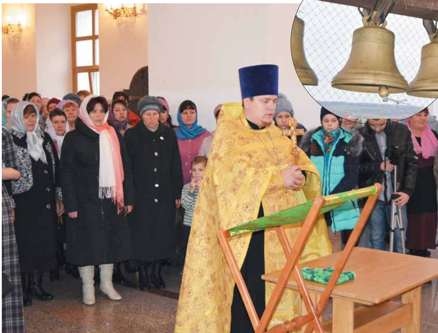
■ Перед началом фестиваля в Суходонецком храме был отслужен молебен

В нем приняли участие не только жители Сухого Донца, но и окрестных сёл