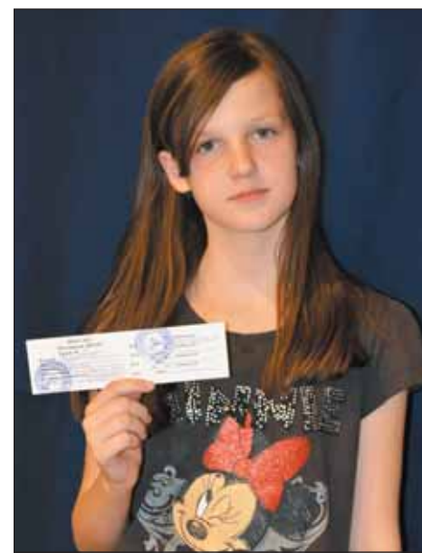
Документ обязывает ко многому