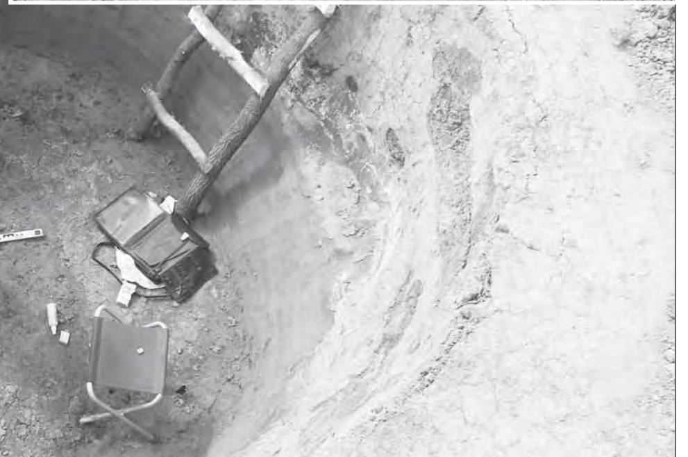
■ Курганный могильник «Ёлка» Новохоперский район